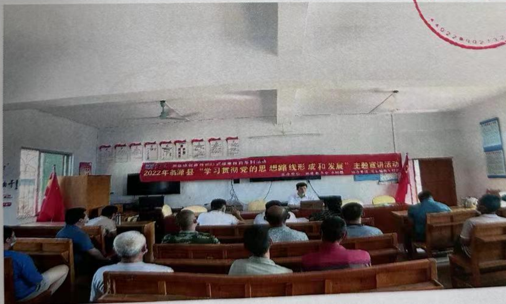
(二) “学习贯彻党的思想路线”宣传横幅