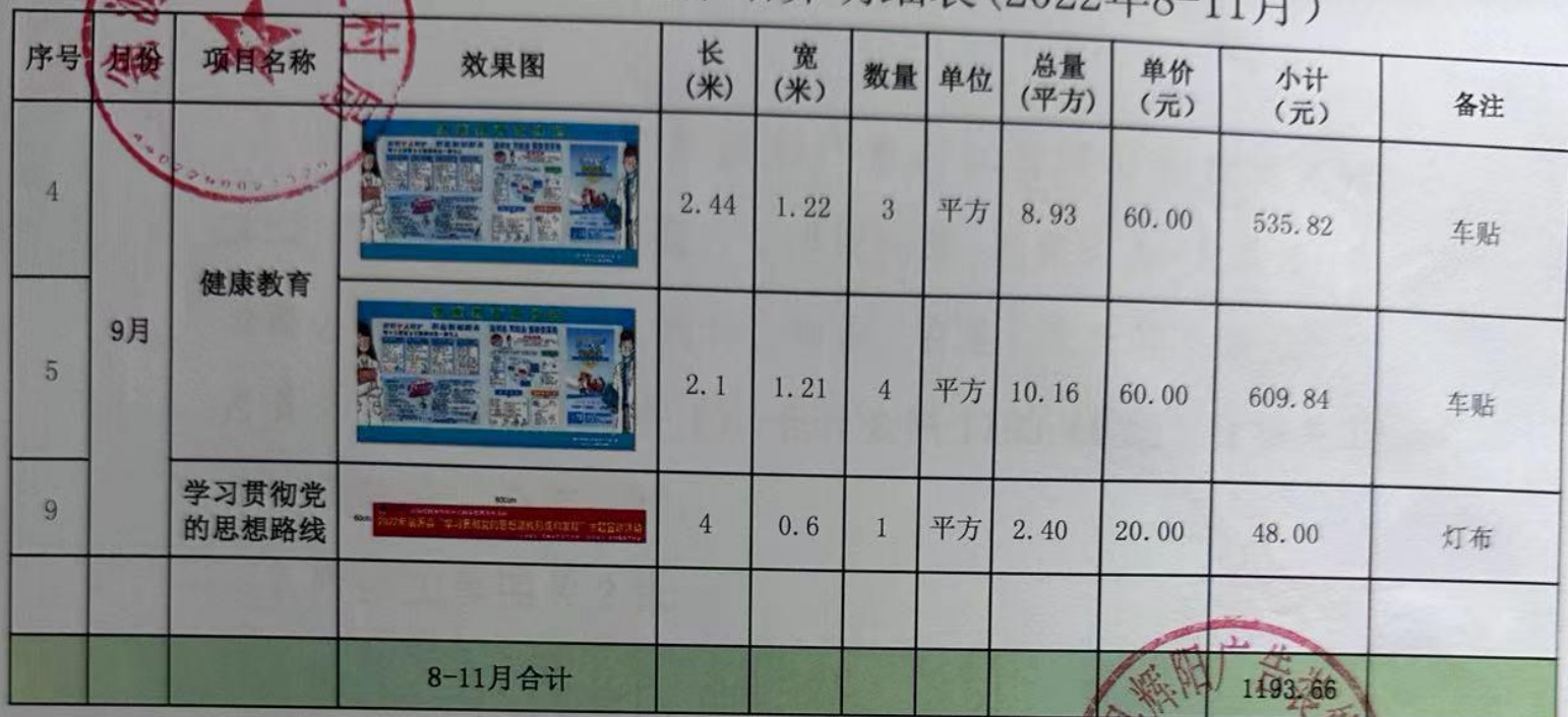
农业农村局广告制作结算明细表(2022年8-11月)