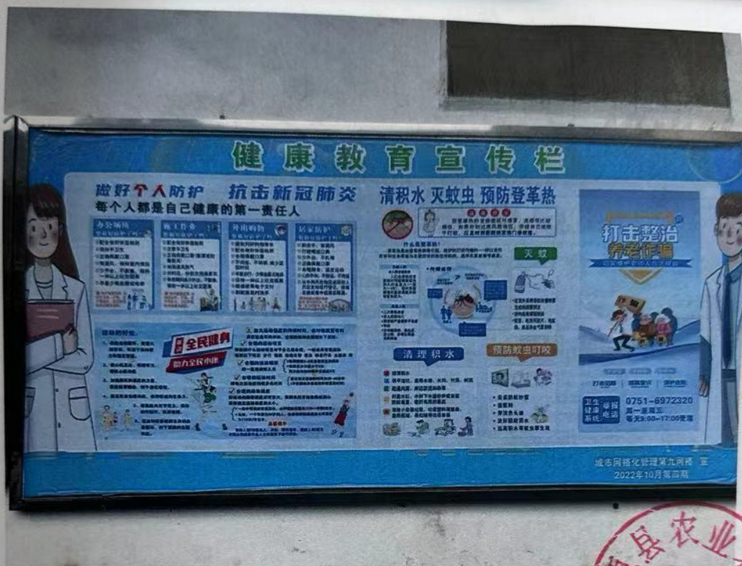
(一) 健康教育宣传栏