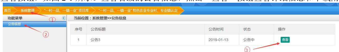
图 2-1 公告信息管理页面

1. 查看公告信息： 点击【系统管理】频道，点击【公告信息】菜单，进入公告信息管理页面，有查看按钮，如图 2-1 所示。查看省级的公告信息，点击“查看”按钮查看详细信息和下载附件。