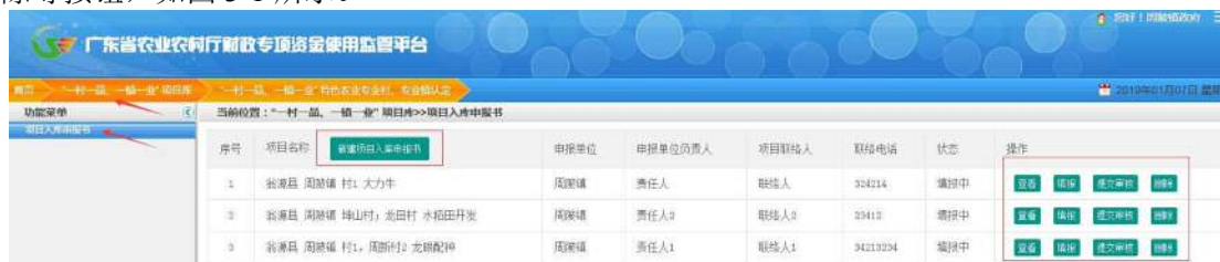
图 3-1 项目入库申报书管理页面

1. 查看项目入库申报书： 点击【“一村一品、一镇一业”项目库】频道，点击【项目入库申报书】菜单，进入项目入库申报书管理页面，有新建项目入库申报书、查看、填报、提交审核、删除等按钮，如图 3-1 所示。