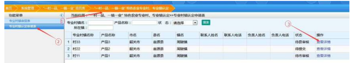
图 4-2 专业村镇认定申请表信息

1. 专业村镇认定申请表： 点击【专业村镇认定申请表】菜单，进入专业村镇认定申请表管理页面，有搜索、查看详情、审核等按钮，如图 4-2 所示。填写搜索条件，点击“搜索”按钮，查看申报表列表信息。