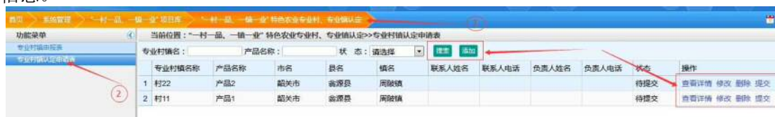
图 4-3 专业村镇认定申请表管理页面

1. 专业村镇认定申请表： 点击【“一村一品、一镇一业”特色农业专业村、专业镇认定】频道，点击【专业村镇认定申请表】菜单，进入专业村镇认定申请表管理页面，如图 4-3 所示，有搜索、添加、查看详情、修改、删除、提交等按钮。填写搜索条件，点击“搜索”按钮，查看申报表列表信息。