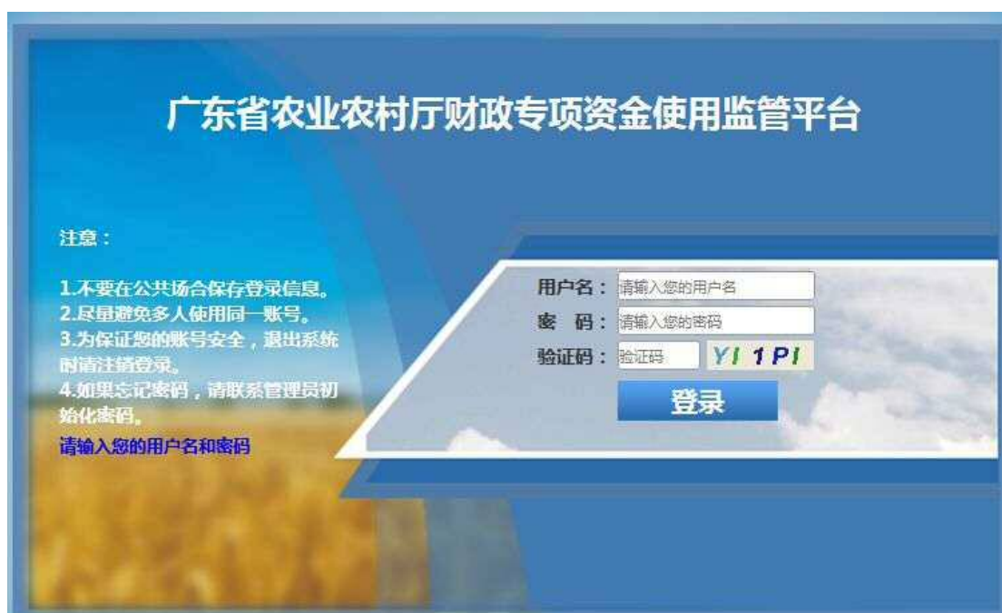
图 1-1 登录页面

本系统必须按核发的登录入口地址和账号密码，通过登录界面进入系统。登录界面如图 1-1 所示。登录入口地址： http://183.62.243.8:8080/s/login 。县（市、区）政府账号：地区名称+政府，比如天河区政府；县（市、区）农业农村局账号：地区名称+农业。所有账号的默认密码都是：nc123456，各单位工作人员登录系统后需更改密码。如果忘记密码，找上级（市）初始化为默认密码。