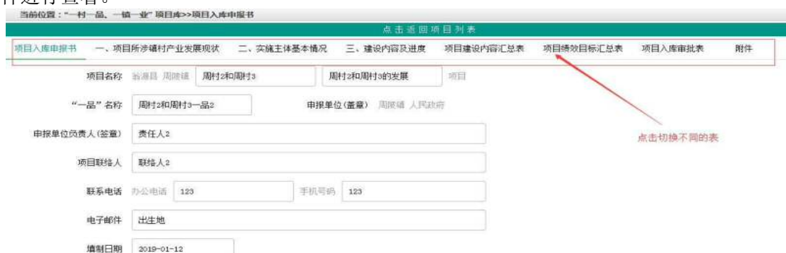
图 3-2 项目详细信息

查看项目详细信息：点击项目“查看”按钮，查看项目的详细信息，如图 3-2 所示，点击表名选项卡，切换各个表进行展示内容，镇级填报上传了附件的，可以点击“下载”按钮下载附件进行查看。