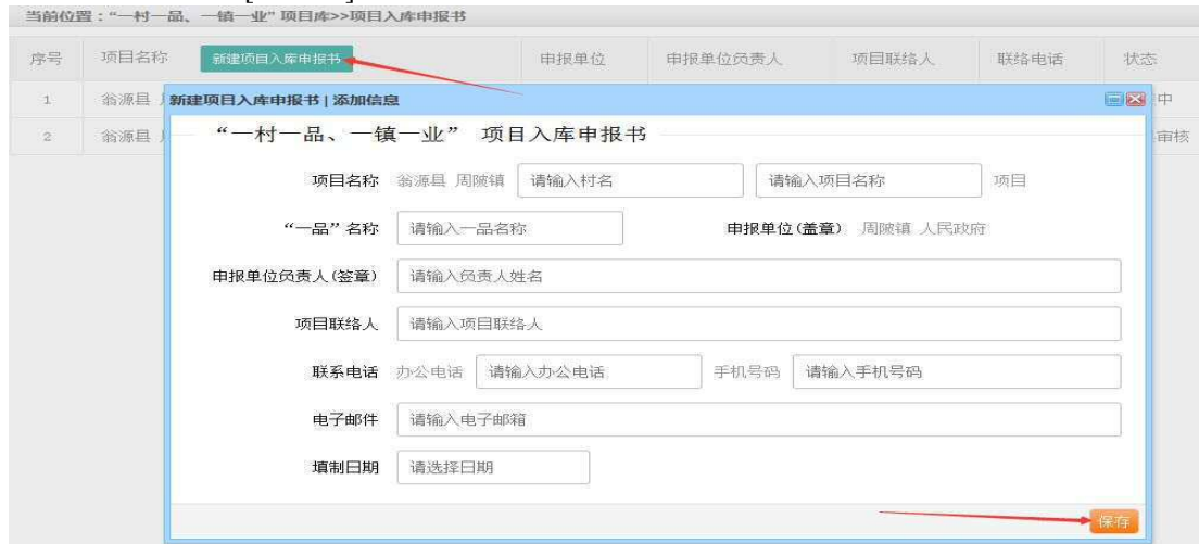
图 3-2 项目入库申报书添加

6. 新建项目入库申报书： 点击“新建项目入库申报书”打开添加信息窗口，如图 3-2 所示，填写项目入库申报书的基本信息，点击“保存”按钮添加一条新的项目入库申报书。新添加的项目入库申报书，处于[填报中]状态，就可以对项目入库申报书进行填写详细信息。