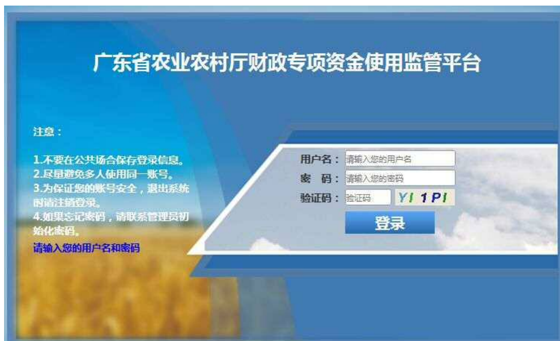
图 1-1 登录页面

本系统必须按核发的登录入口地址和账号密码，通过登录界面进入系统。登录界面如图 1-1 所示。登录入口地址： http://183.62.243.8:8080/s/login 。账号：地区名称+政府，比如沙河街道政府（**镇政府）。所有账号的默认密码都是：nc123456，各单位工作人员登录系统后需要更改密码。如果忘记密码，找上级（县区）初始化为默认密码。