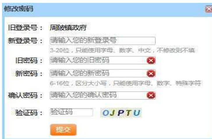
图 1-3 密码修改