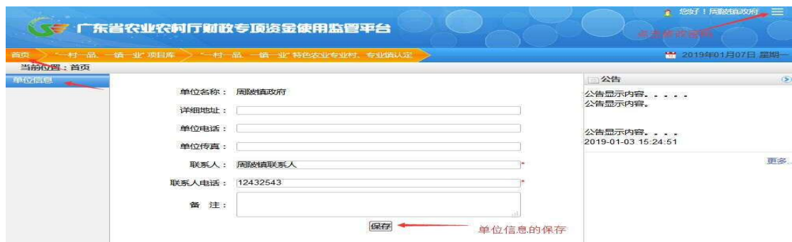
图 1-2 首页页面