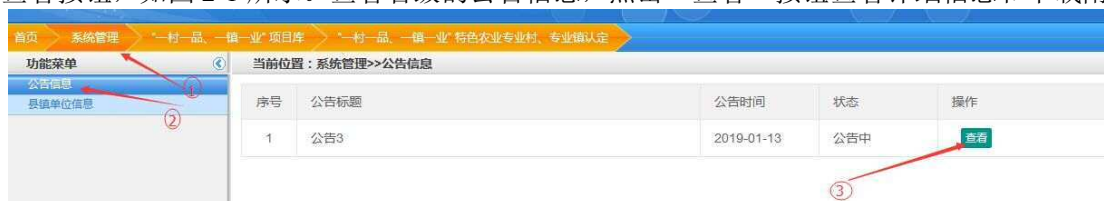
图 2-1 公告信息管理页面

1. 查看公告信息： 点击【系统管理】频道，点击【公告信息】菜单，进入公告信息管理页面，有查看按钮，如图 2-1 所示。查看省级的公告信息，点击“查看”按钮查看详细信息和下载附件。