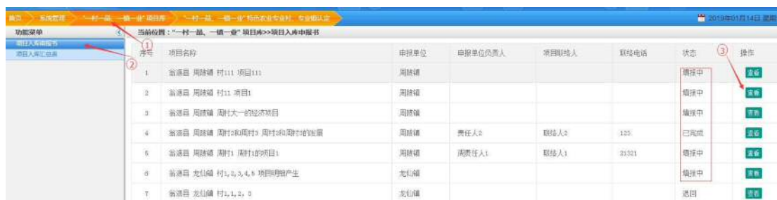
图 3-1 项目入库信息页面

1. 查看项目入库申报书：点击【“一村一品、一镇一业”项目库】频道，点击【项目入库申报书】菜单，进入项目入库申报书管理页面，查看镇级填报的项目，如图 3-1 所示。