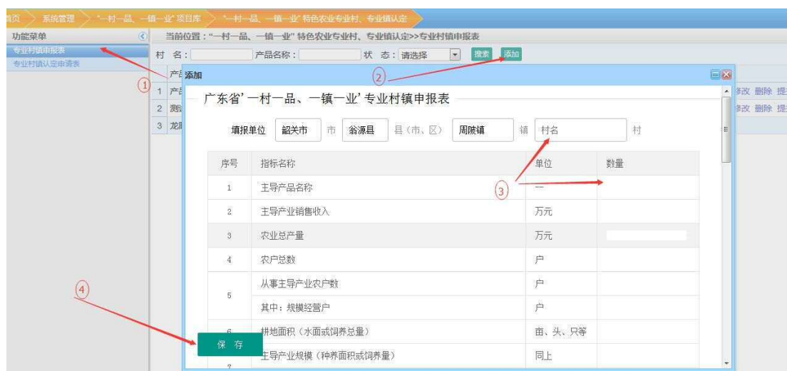
图 4-2 专业村镇申报添加